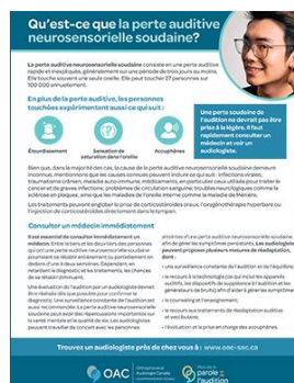
Fiche de renseignement sur la perte auditive neurosensorielle soudaine