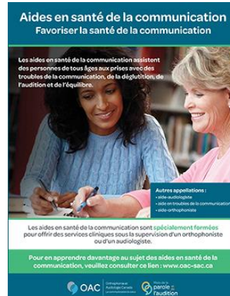
Affiche sur les aides en santé de la communication

D'autres ressources – pour d'autres ressources, veuillez accéder notre trousse des ressources .