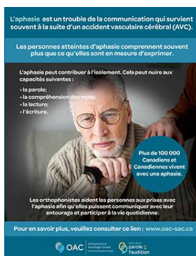
Affiche sur l'aphasie